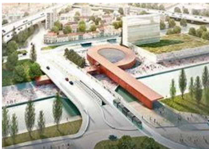
BIG & Silvio d'Ascia Architecture - Station de métro de la Ligne 15 Est du Grand Paris Express Bondy

L'architecture de cette future gare a fait l'objet d'un concours international.