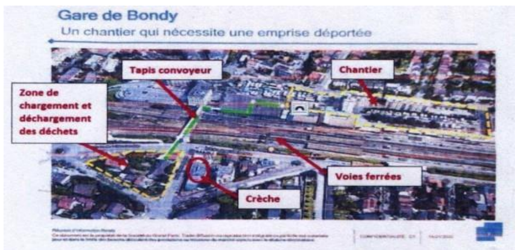
Plan des travaux transmis par le collectif d'habitants