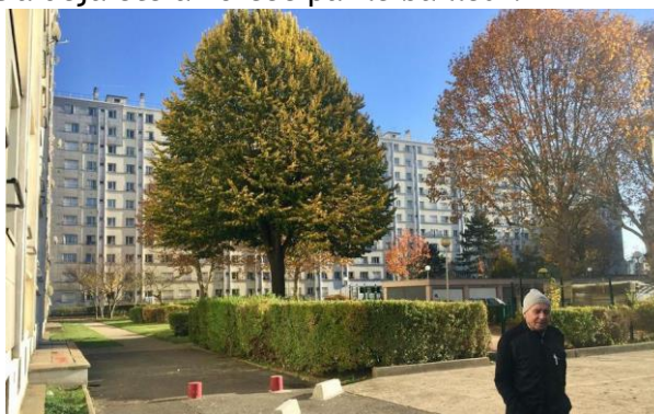
Quartier de la Sablière

Les trois barres de dix étages, vétustes, devraient être détruites. Une seule, de 30 logements, resterait sur pieds. Les démolitions et reconstructions dans la cité s'étaleront jusqu'en 2030. La politique de relogement a déjà été amorcée par le bailleur.