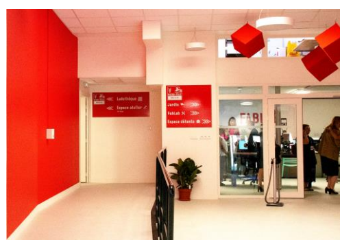
Bureau de la Micro-folie