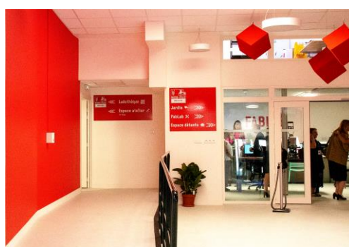
Bureau de la Micro-folie