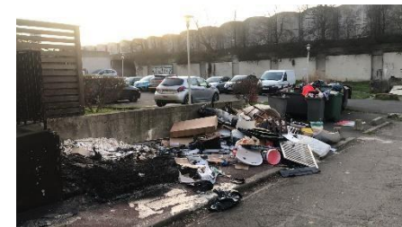
Stockage déchets Avenue Jean Moulin