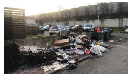
Stockage déchets Avenue Jean Moulin