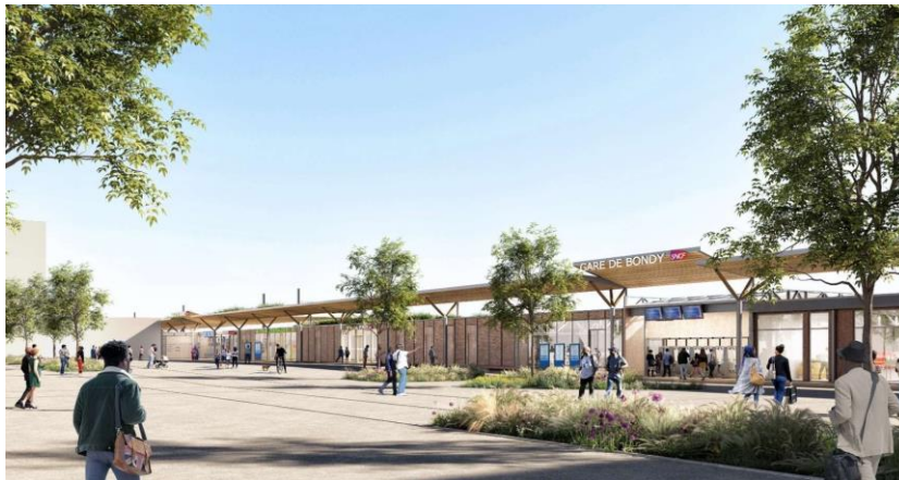
Gare de Bondy réaménagée et agrandie

Un PowerPoint a été diffusé suite aux informations que la ville ainsi qu'un groupe de riverain ont pu collecter sur l'installation de deux gares (métro + train) sur le site actuel de la gare.