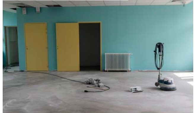
Installation d'un placard et création de deux réserves (l'une dédiée au rangement, l'autre pour la baie électrique)

Rappel coût de l'opération : 2 776 229 €