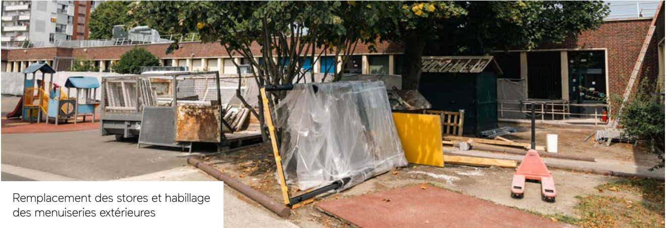
Remplacement des stores et habillage des menuiseries extérieures