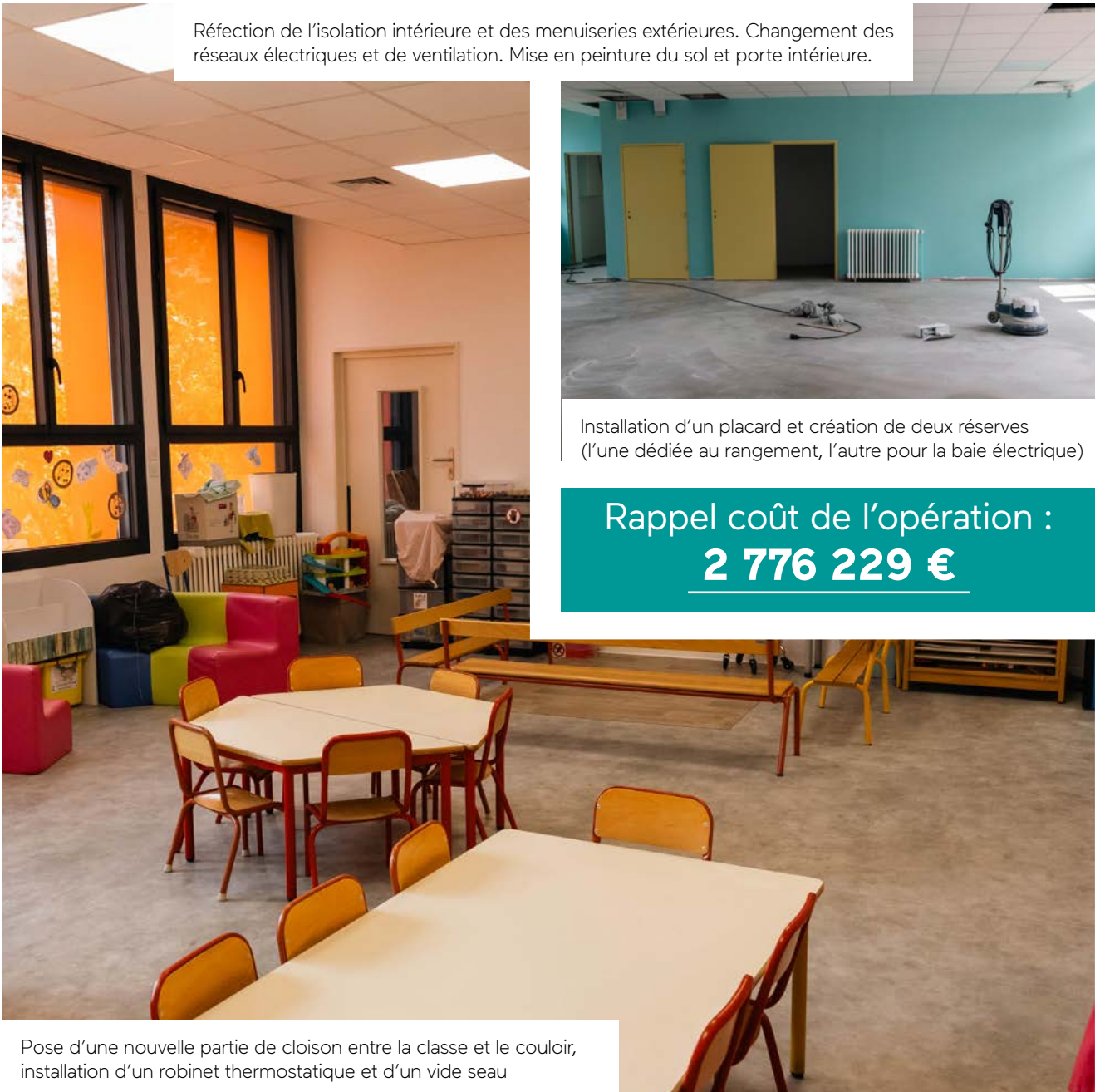
Réfection de l'isolation intérieure et des menuiseries extérieures. Changement des réseaux électriques et de ventilation. Mise en peinture du sol et porte intérieure.